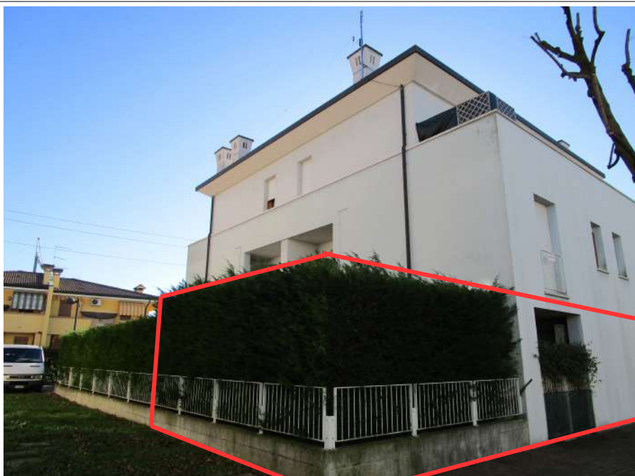
Foto 3 – Prospetti nord-ovest con indicato sommariamente il compendio immobiliare Subb.26-27