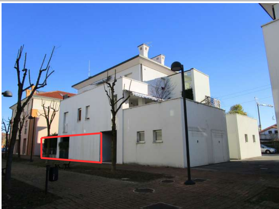
Foto 2 – Prospetto sud-ovest con indicato sommariamente il compendio immobiliare Subb.26-27