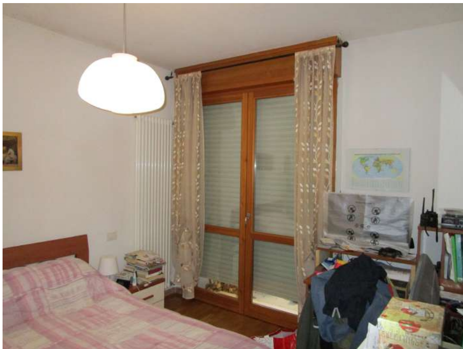
Foto 4 - Camera da letto ricavata nel Pranzo-Soggiorno-Letto. Porta-finestra per accedere al Portico.