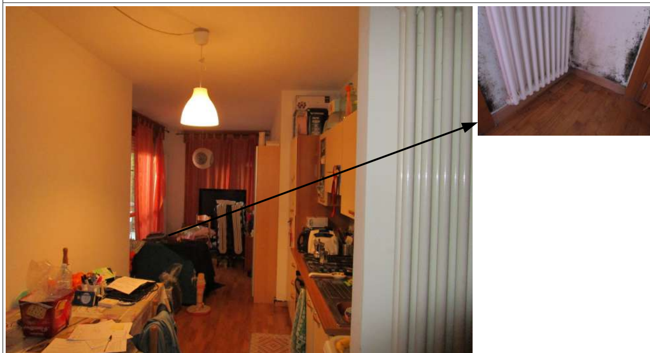
Foto 2 – Pranzo-Soggiorno – Ripresa fotografica dalla porta d'ingresso. A destra angolo cottura e sul fondo due porte-finestra per accedere al Portico e alla Corte esclusiva. A sinistra il muro in cortongesso elevato per ricavare una Camera da letto. Presenti muffe lungo le pareti perimetrali esterne.