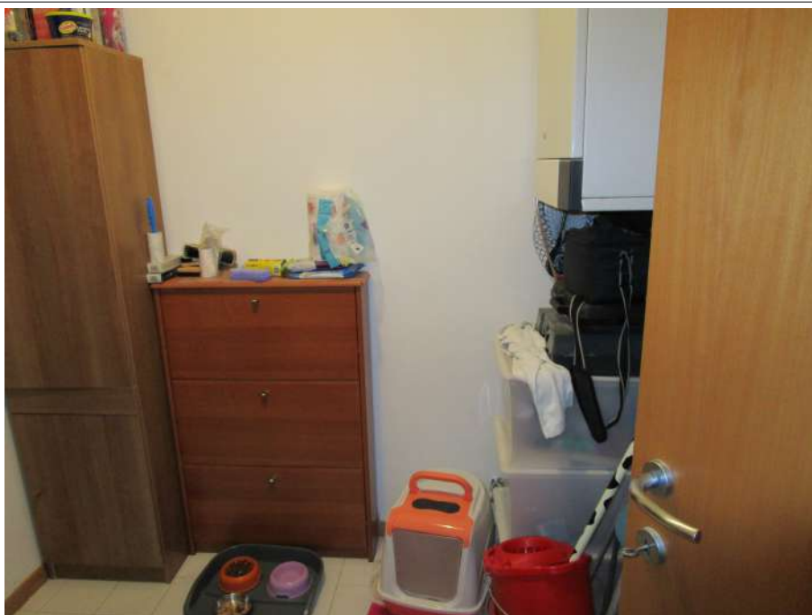
Foto 6 – Antibagno – Ripresa fotografica dal Pranzo-Soggiorno. A destra caldaia murale.