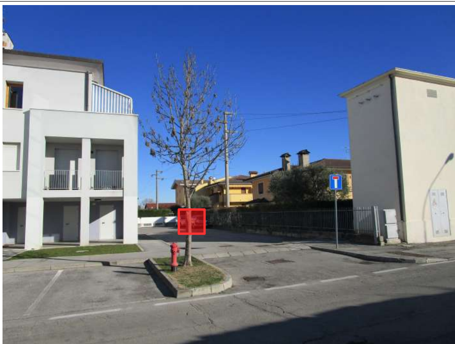
Foto 4 - Sistemazione area esterna Sub.1 a est del Lotto. Indicato sommariamente con il riquadro il Posto auto di proprietà Sub.33 (l'ultimo da sud)