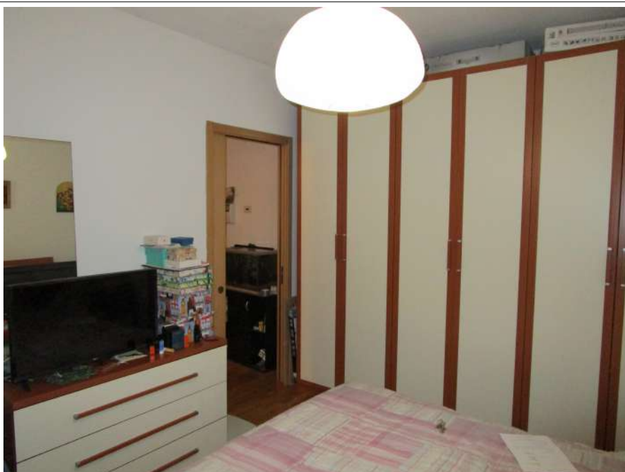
Foto 5 - Camera da letto con ingresso dal Pranzo-Soggiorno