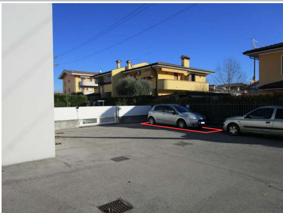
Foto 5 - Posto auto scoperto di proprietà