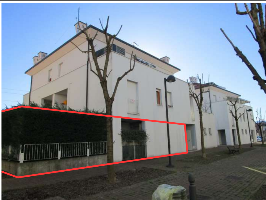
Foto 1 – Prospetto est - Vista dalla Piazza Don Rino Brasola. Indicato sommariamente l'unità immobiliare Sub.26 con portico e corte esclusiva Sub.27

Immagini 1-2 - Viste da GoogleMaps. Indicato sommariamente il fabbricato condominiale e l'area esterna (corte esclusiva Sub.27 e posto auto Sub.33) dell'unità residenziale Sub.26